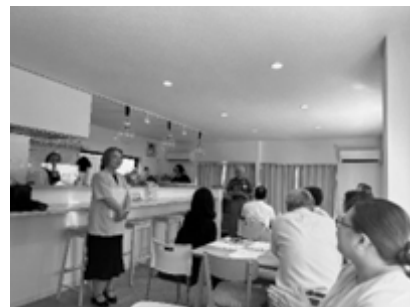
新事務所開所式で挨拶する久保さん