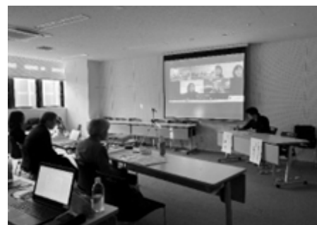
選考委員会(組織応援コース;2025年2月)

この基金の下に、いずれも個人・法人(企業)の浄財により設立された冠基金があり、それぞれの寄付者の意向に基づいた分野に助成金を充当しています。年々進化を遂げており、2024年度は、若者が主体となって行う活動を支援する為の若者活動応援分野が新設され、今期2025年度は、組織基盤強化のための助成である「組織応援コース」も新設されました。そうした分野・コースの多岐化に対応すべく、選考委員会も3つの委員会が設置され、それぞれで選考を行いました。