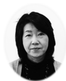
故・有園博子さん

有園博子基金は、2017年に逝去された故有園博子さんのご遺志を受けて創設された基金です。有園博子さんの遺言に従い、兵庫県内において、1)DV 被害者、2)虐待された子ども、3)性暴力の被害者、4)JR福知山線脱線事故のご遺族、の4分野での活動・研究へのご支援を行ってきました。前回2024年度助成より、支援の網の目からこぼれる「隙間」を常に重視してこられた有園さんのご遺志に鑑み、また社会状況の変化を踏まえて対象分野を拡大し、上記4分野に加えて、「5)困難な状況にある女性への支援活動」も対象とすることとしています。これにより、被害当事者や困難な状況にある女性を支えるセーフティネットがより厚くなり、人が人として生きやすい社会をつくることに繋がればと願っております。