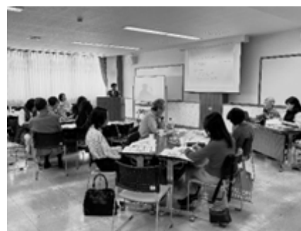
キックオフ・ミーティング(2024年6月2日)